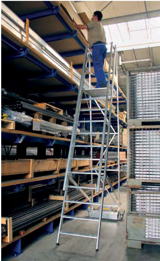
Abb. Bestell-Nr. 52712